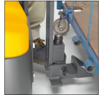
Soluciones de enganche individualizadas adaptadas al remolque