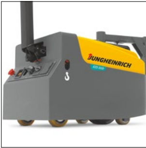
Elementos de mando claramente dispuestos