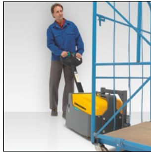
Maniobrar los remolques con facilidad