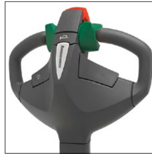
Barra timón ergonómica