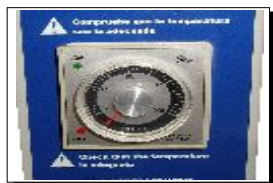
Control de temperatura.