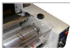
Regulador de presión y protector de rodillos.