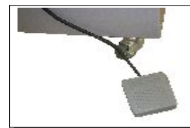
Detalle del pedal y ruedas de desplazamiento de la mesa soporte.