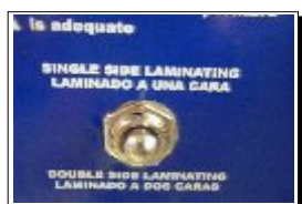
Selector de laminado a 1 ó 2 caras, (encapsulación).