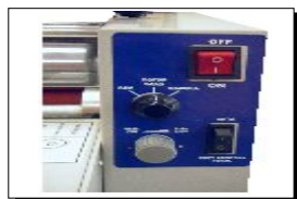
Control de velocidad, reverse, pedal y modo automático.