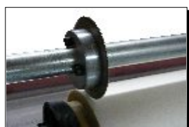
Sistema de pre-corte.