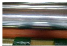
Rodillo térmico metálico calefactado.