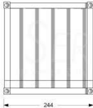
Vista Lateral Izq.